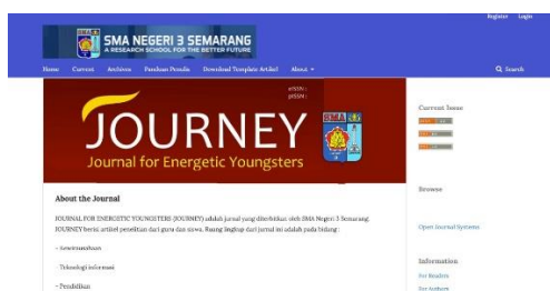
Gambar 3. Jurnal yang telah diterapkan di SMA Negeri 3, Semarang

Gambar 3, menjelaskan, jurnal yang dimiliki oleh SMA Negeri 3, Semarang merupakan jurnal yang akan mewakili penelitian-penelitian yang dilakukan oleh guru dan siswa. Apakah manfaat riset itu?