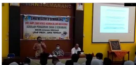
Gambar 2. Pengabdian masyarakat di SMA Negeri 3, Semarang

Gambar 1, menjelaskan tahapan pengabdian yang kami lakukan. Pertama-tama kami berdiskusi dengan SMA Negeri 3, Semarang yang telah menjadi mitra kami dalam pengabdian masyarakat dalam pengembangan riset khusus siswa siswi SMA Negeri 3, Semarang. Dari hasil diskusi tersebut, menghasilkan jurnal khusus SMA Negeri 3, Semarang dan pengurusan ISSN dibutuhkan agar guru dan siswa dapat segera mempublikasikan hasil risetnya