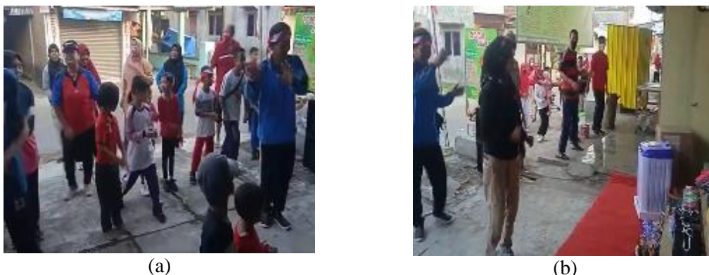
Gambar 3. Acara senam pagi sebelum jalan sehat (a) Wanita dan anak-anak (b) Laki-laki

yang ada di dalam tubuh kita menjadi normal kembali. Sedangkan hasil dokumentasi untuk kegiatan yang kedua dapat dilihat pada Gambar 3.