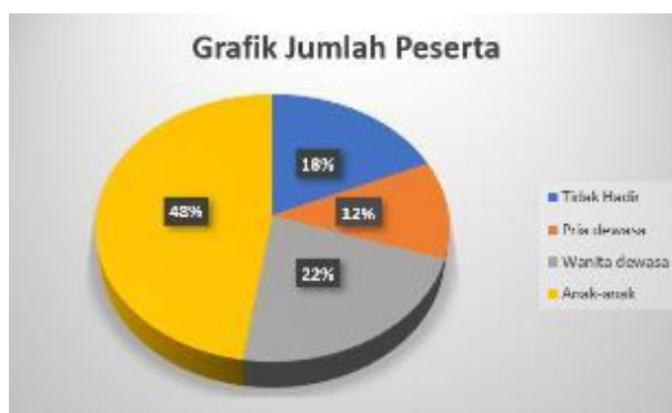
Gambar 1. Grafik perbandingan jumlah peserta yang hadir

Berdasarkan data pada Gambar 1., menunjukkan bahwa antusiasme warga dalam mengikuti acara pengabdian masyarakat ini yang paling tinggi adalah bagi anak-anak. Hal ini dapat menjadi sangat baik dikarenakan kita dapat menanamkan nilai-nilai kebangsaan pada masyarakat mulai dari sejak kecil.