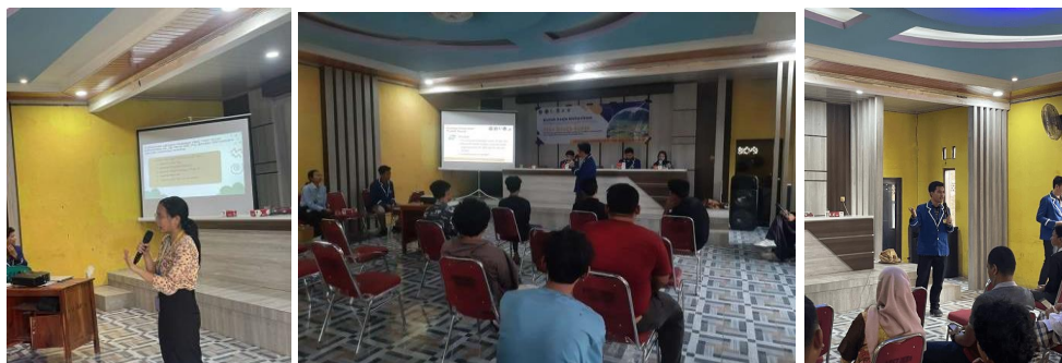
Gambar 3. Sosialisasi Tata Kelola dan Akuntansi BUM Desa

Materi sosialisasi yang disampaikan terkait dengan tata kelola BUM Desa menurut Peraturan Pemerintah Nomor 11 Tahun 2021 tentang Badan Usaha Milik Desa. Pada kegiatan tersebut juga dipaparkan hasil evaluasi pengelolaan BUM Desa periode sebelumnya dan pengenalan konsep dasar akuntansi dalam pencatatan laporan keuangan BUM Desa.