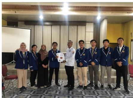
Gambar 7. Dokumentasi Penyerahan Luaran KKM

Luaran KKM juga diserahkan melalui media elektronik berupa link google drive kepada perangkat Desa Ranca Buaya. Luaran KKM yang disimpan dalam media elektronik memiliki kelebihan dapat dimanfaatkan/dipelajari kembali oleh perangkat Desa dan pengelola BUM Desa Rancabuaya di masa mendatang.