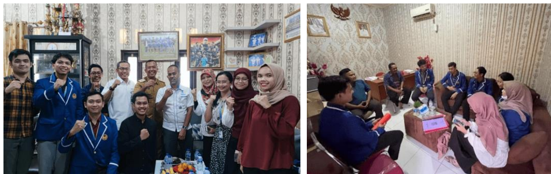
Gambar 2a. Koordinasi diskusi dengan Kepala Desa. 2b. Diskusi dengan Pengurus BUM Desa