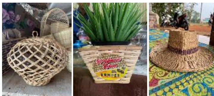
Gambar 5. Produk Kerajinan Rotan Desa Ranca Buaya

Pembuatan katalog produk kerajinan rotan juga menjadi salah satu bentuk kontribusi Tim Pengmas KKM dalam mendukung kegiatan usaha BUM Desa Ranca Buaya Sejahtera. Katalog produk tersebut diharapkan menjadi media promosi yang menyediakan informasi dalam memasarkan produk-produk kerajinan rotan unggulan yang ada di Desa Ranca Buaya. Proses penyusunan katalog produk kerajinan tangan dilakukan dengan melakukan kunjungan ke pengrajin rotan yang ada di desa Ranca Buaya untuk memperoleh gambar produk kerajinan rotan yang dihasilkan serta spesifikasi dari produk kerajinan rotan tersebut. Selanjutnya dengan bantuan aplikasi desain, gambar-gambar produk tersebut disusun sedemikian rupa sehingga menghasilkan daftar produk-produk kerajinan yang informatif.