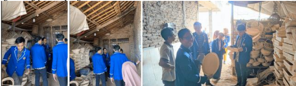
Gambar 4. Kunjungan ke Perajin Rotan

Penyusunan harga pokok produksi didasarkan pada informasi mengenai biaya-biaya dalam pembuatan produk kerajinan rotan yang diperoleh dari hasil kunjungan ke beberapa pengrajin rotan yang ada di Desa Ranca Buaya. Informasi yang diperoleh berupa bahan baku yang digunakan beserta harga per satuan, biaya upah tenaga kerja, serta biaya overhead secara keseluruhan. Seluruh biaya tersebut dilakukan perhitungan untuk mengalokasikan biaya-biaya ke masing-masing produk yang dihasilkan.