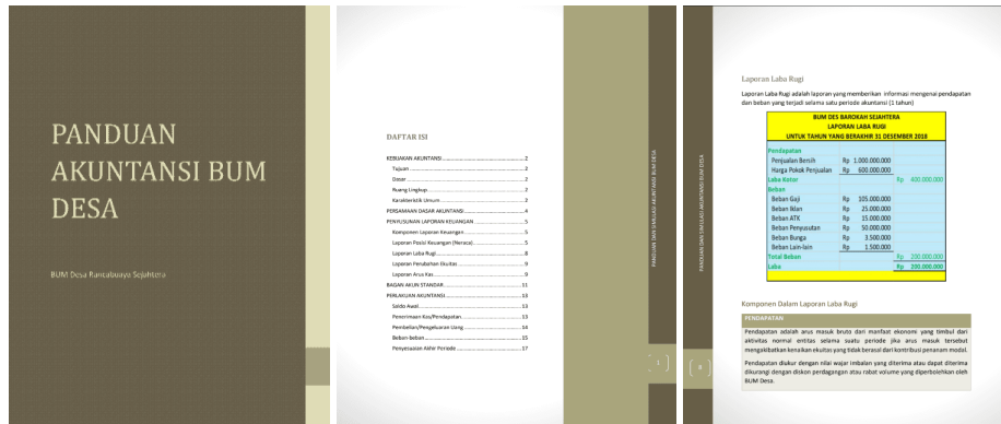
Gambar 6. Buku Panduan Pencatatan Laporan Keuangan Untuk BUM Desa