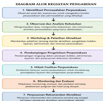
Gambar 1. Diagram alur kegiatan, 2024

Data hasil evaluasi dianalisis secara deskriptif untuk menggambarkan perubahan yang terjadi sebelum dan sesudah program pendampingan dilaksanakan. Tahapan kegiatan di atas digambarkan dalam diagram alur tersebut di bawah ini :