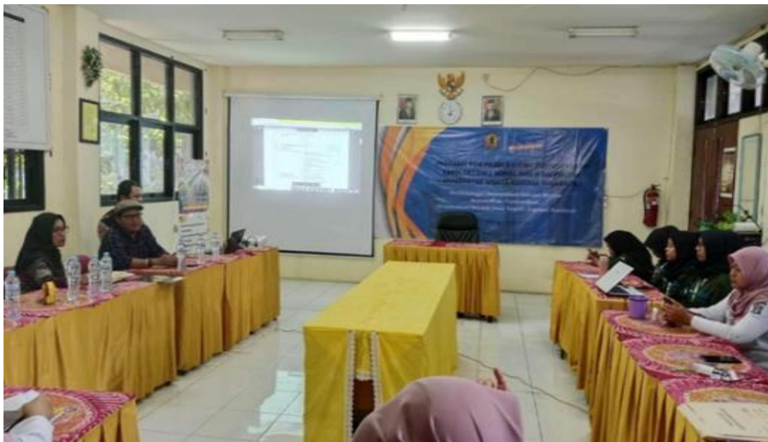
Gambar 2. Workshop Pendampingan materi Akreditasi, 2024

pelatihan berbasis praktik lebih mudah dipahami oleh peserta dibandingkan hanya melalui penyampaian teori. Temuan ini sejalan dengan penelitian Simarmata et al.(13) yang menjelaskan bahwa pelatihan berbasis praktik dan pendampingan langsung mampu meningkatkan kompetensi pengelola perpustakaan secara lebih efektif.