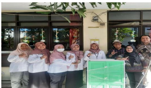
Gambar 3. Serah Terima Almari Buku, 2024

Dampak hibah fasilitas yaitu dengan pemberian dua unit almari buku membantu meningkatkan kapasitas penyimpanan koleksi perpustakaan. Sebelum program berlangsung, sebagian koleksi masih ditumpuk dan belum tertata dengan baik. Setelah penambahan fasilitas, koleksi dapat disusun berdasarkan klasifikasi sehingga ruang perpustakaan menjadi lebih rapi dan nyaman. Perbaikan fasilitas ini juga berdampak terhadap peningkatan minat kunjung siswa ke perpustakaan. Perubahan pemanfaatan perpustakaan dari hasil observasi menunjukkan adanya peningkatan kunjungan siswa sebesar 30% dalam satu bulan setelah program berlangsung. Guru juga mulai memanfaatkan perpustakaan sebagai sumber pembelajaran dengan memberikan tugas berbasis pencarian informasi. Peningkatan aktivitas perpustakaan menunjukkan bahwa perbaikan pengelolaan dan layanan perpustakaan dapat berkontribusi terhadap penguatan budaya literasi sekolah.