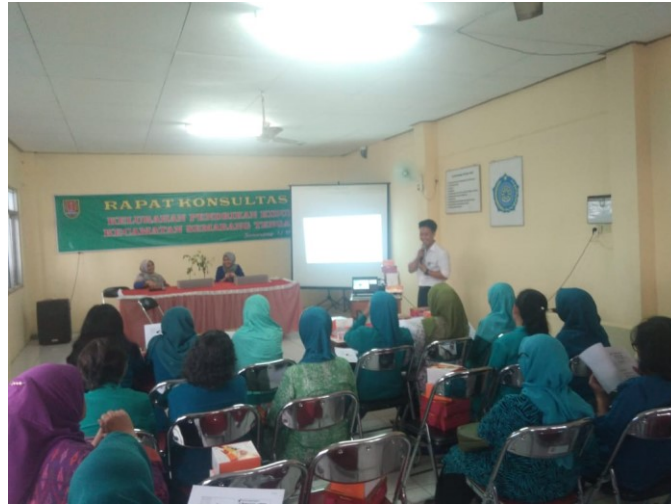
Gambar 2. Pembekalan Materi tentang bahan makan organik dan sistem akuaponik di kelurahan Pendrikan Kidul

Setelah melaksanakan pembekalan pengetahuan dilanjutkan dengan melakukan pelatihan pembuatan dan cara kerja sistem akuaponik kepada peserta pelatihan. Pada Gambar 2 dapat dilihat proses pelatihan yang dilakukan di kantor kelurahan pendrikan kidul. Pada tahap ini peserta diajak untuk membuat dan mempelajari sistem akuaponik secara langsung.