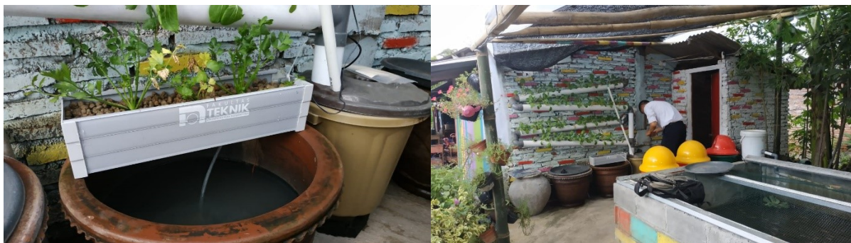
Gambar 4. Pendampingan dan pemasangan system akuaponik di rumah warga pendrikan kidul

Pada Gambar 4 dapat dilihat proses pemasangan dan pendampingan yang dilakukan di salah satu rumah warga Pendrikan Kidul. System akuaponik yang terpasang merupakan sebuah system otomatis dengan menggunakan sebuah pompa listrik dan dipasang pada gentong berisikan ikan lele sebagai bagian akuakulturnya.