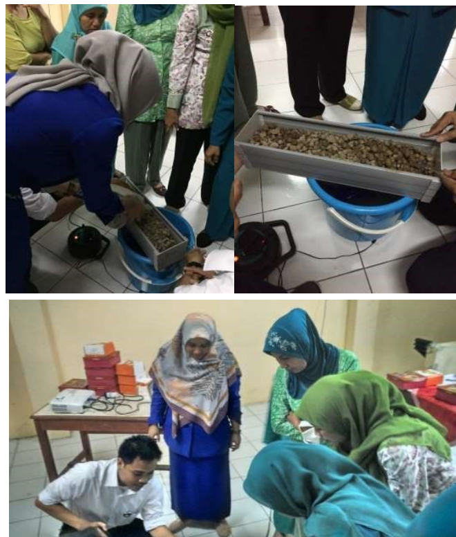
Gambar 3. Peserta melakukan pelatihan pembuatan sistem akuaponik

Setelah melaksanakan pembekalan pengetahuan dilanjutkan dengan melakukan pelatihan pembuatan dan cara kerja sistem akuaponik kepada peserta pelatihan. Pada Gambar 2 dapat dilihat proses pelatihan yang dilakukan di kantor kelurahan pendrikan kidul. Pada tahap ini peserta diajak untuk membuat dan mempelajari sistem akuaponik secara langsung.