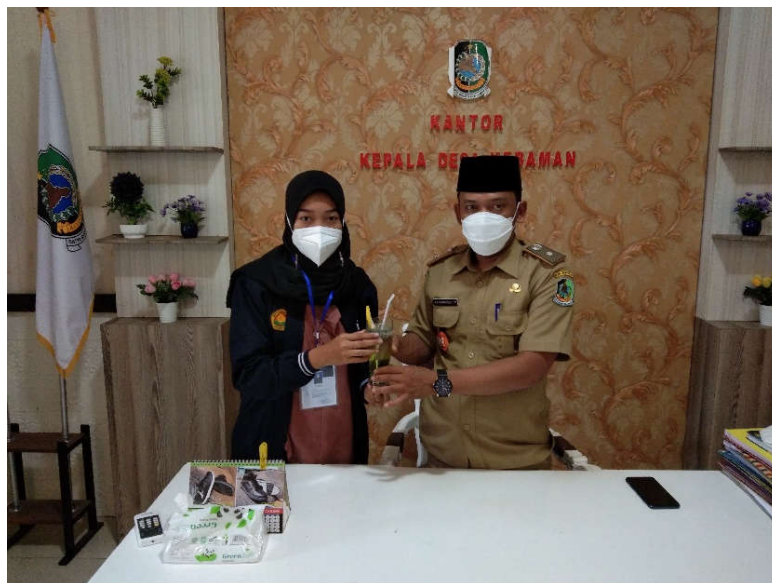
Gambar 5. Pengenalan hasil kegiatan kepada Kepala Desa