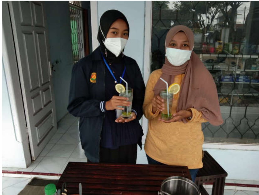
Gambar 4. Pelatihan strategi peningkatan value added