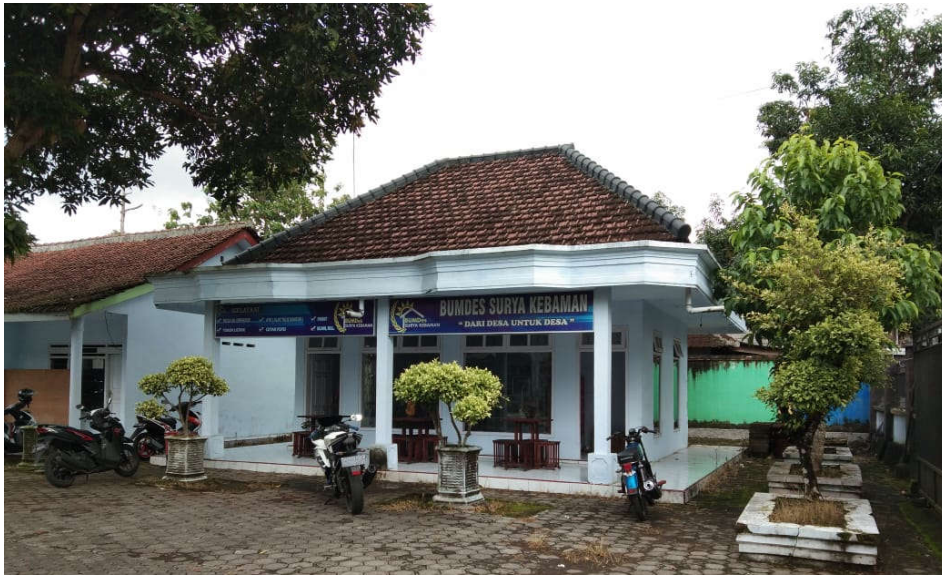
Gambar 1. BUMDes Surya Kebaman

Kegiatan Kuliah Kerja Nyata Back to Village 3 dilakukan di Desa Kebaman, Kecamatan Srono, Kabupaten Banyuwangi dengan tematik Program Pemberdayaan BUMDes/Jaring Pengaman Desa Penanganan COVID-19. Kegiatan pengabdian ini memiliki tujuan untuk meningkatkan efisiensi kinerja para pengelola dan meningkatkan pendapatan yang diperoleh melalui strategi marketing yang baru, digitalisasi pencatatan penjualan, dan pengembangan mini cafe. Sosialisasi dilakukan kepada sasaran terkait pentingnya layout produk sebagai salah satu strategi marketing . Salah satu manfaat dari layout produk yaitu penghematan penggunaan ruangan yang dibutuhkan [4]. Efisiensi penggunaan ruangan ini akan menguntungkan karena ruangan akan punya tempat yang kosong sehingga dapat diisi oleh produk lainnya.