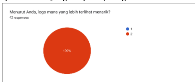
Gambar 3. Ketertarikan konsumen terhadap logo

Disamping itu, penggunaan desain baru pada segel dan logo juga mempengaruhi ketertarikan konsumen terhadap produk. Kelompok melakukan riset dengan penyebaran kuesioner dan menunjukkan hasil yang disajikan pada grafik dibawah ini.