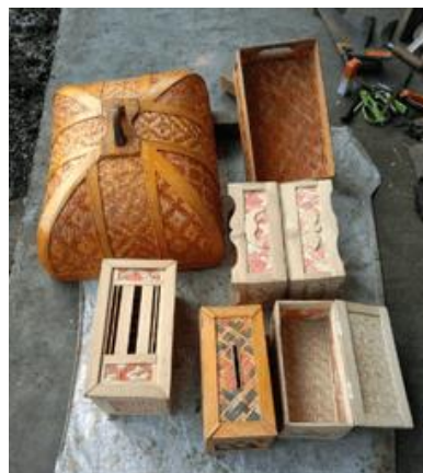
Gambar 7. Hasil kerajinan Chris Betena, seorang peserta workshop setelah dua bulan kegiatan workshop berlangsung.

Monitoring dan evaluasi dilakukan secara komunikasi jarak jauh menggunakan media ponsel melalui group WhattsApp. Tidak dilakukan dengan kunjungan balik ke lokasi workshop. Hal ini karena hambatan geografis dari lokasi nara sumber ke lokasi pengrajin. Namun tetap berjalan efektif karena para pengrajin berhasil memperlihatkan hasil kerajinan mereka lewat media ponsel (lihat Gambar 7).