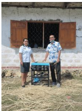
Gambar 5. Diseminasi alat dari LPPM Unram pelaksana kegiatan workshop diterima secara simbolis oleh Dinas Koperasi UKM Perindustrian dan Perdagangan Sumba Barat Daya.

Dalam hal pemasaran hasil produk kerajinan bambu bisa dilakukan dengan cara online atau dengan menitipkan hasil olahan kerajinan di lokasi-lokasi wisata yang ada di Sumba Barat Daya. Selama ini para pengrajin produk bambu tidak optimal dalam pemasaran hanya mengandalkan metode konvensional yaitu menunggu pembeli datang ke lokasi pengrajin, akibatnya hasil yang diperoleh dari penjualan hasil kerajinan bambu tidak optimal.