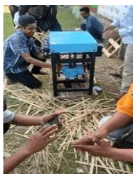
Gambar 6. Antusiasme peserta workshop menjalankan alat.

Pada Gambar 6 terlihat sikap antusias peserta menggunakan alat pengirat bambu. Sebelumnya peserta menyediakan dua lonjor bambu utuh. Kemudian bambu tersebut dipotong sepanjang 50 cm, lalu dibelah hingga seukuran lebar 3 cm. Hasil belahan tersebut dimasukkan ke dalam rol pembelah. Dari rol pembelah, belahan bambu keluar menjadi seukuran 1 cm sebanyak 3 buah belahan. Selanjutnya belahan tersebut dimasukkan di sisi lain dari alat hingga keluar iratan sebesar 3 mm sebanyak 3 buah. Hasil dari iratan bambu ini sudah dalam keadaan halus sehingga bisa langsung dipakai sebagai tusuk sate, sumpit, jeruji kandang burung, piring anyaman bambu dan lain lain.