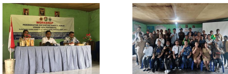
Gambar 3. Dinas Kemetrian Desa, Dinas Koperasi UKM Perindustrian dan Perdagangan Kab. Sumba Barat Daya, dan LPPM Unram membuka acara kegiatan workshop disertai dengan foto bersama para peserta workshop.

Setelah selesai kegiatan ceramah dan demonstrasi alat, peserta kembali dibagikan kuisisioner yang sama untuk mengevaluasi hasil penerimaan materi workshop.