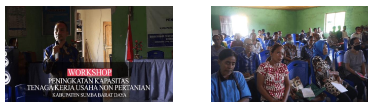
Gambar 4. Penyuluhan pengolahan bambu depan peserta workshop.

Sementara itu isi ceramah secara garis besar adalah menjelaskan pengetahuan umum mengenai bambu, cara pengawetan bambu, cara pengolahan bambu, alat-alat yang digunakan dalam pengolahan bambu, produk produk dari kerajinan bambu dan potensi atau cara pemasaran produk bambu (Gambar 4).