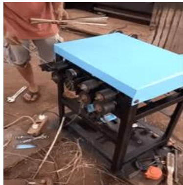
Gambar 2. Pengujian alat di Bengkel Rotani, Mataram

Prinsip kerja alat adalah tenaga motor listrik daya dari motor ditransmisikan dengan puli dan sabuk ke poros yang memutar roller. Bambu yang sudah dipotong sesuai ukuran yang diinginkan diarahkan pada roller sisi kanan untuk perajangan. Bambu diletakkan pada pengarah untuk ditarik roller dan akan terbelah menjadi beberapa bagian. Setelah perajangan, bambu diarahkan pada roller sisi kiri untuk penyerutan, bambu diletakkan pada pengarah untuk ditarik roll dan diserut menjadi bulat (lihat Gambar 2).