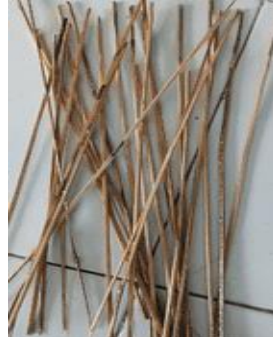
Gambar 7. Hasil iratan bambu menggunakan mesin.

Pada Gambar 7 diperlihatkan hasil iratan bambu yang sudah halus melalui mesin irat bambu .