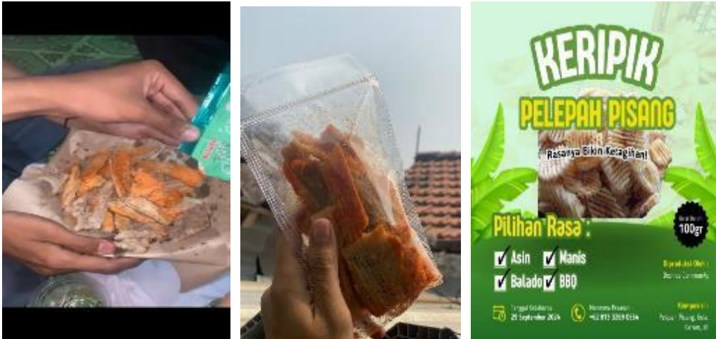
Gambar 3. Dokumentasi Komunitas Dechips Saat melakukan Pedampingan

Pembuatan kripik dari pelepah pisang merupakan usaha untuk meningkatkan ekonomi masyarakat agar dapat menjadi produk yang menarik dan sebagai aset desa. Tujuan dari sosialisasi ini ialah agar didesa sedati muncul mata pencaharian baru yaitu usaha kripik dari pelepah pisang. Selain itu sosialisasi ini diadakan juga karena didesa Sedati terdapat beberapa warga yang berprofesi sebagai petani sehingga usaha ini dapat menjadi usaha sampingan yang dapat menambah penghasilan mereka.