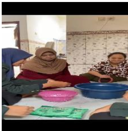
Gambar 2. Sosialisasi sekaligus demonstrasi mengelola kripik dari pelepah pisang

Indonesia merupakan negara yang kaya akan sumber daya alam. Sumber daya alam sendiri diartikan sebagai sumber kekayaan baik berupa benda mati maupun benda hidup yang ada di muka bumi dan dapat dimanfaatkan untuk memenuhi kebutuhan manusia. Sumber daya alam tersebut meliputi pertanian, perkebunan, dan mineral. Pertanian dapat dikatakan sebagai sektor yang dapat menggerakkan kegiatan perekonomian pada sektor lain, sehingga memungkinkan pertanian mendukung pembangunan/perbaikan perekonomian, misalnya pertanian dapat memperluas kesempatan kerja, menggunakan inovasi produk pertanian untuk memberikan peluang wirausaha, dan menciptakan peluang usaha sehingga masyarakat dapat hidup sejahtera yang dimulai dari pedesaan kemudian lanjut untuk memajukan perekonomian nasional [8]. Kemudian dari sisi perkebunan yang mendominasi ialah kelapa sawit yang melimpah sehingga di Indonesia memiliki cadangan minyak sawit yang cukup banyak bahkan sampai diekspor keluar negeri. Dari hasil tambang yang mendominasi ialah PT Freeport .