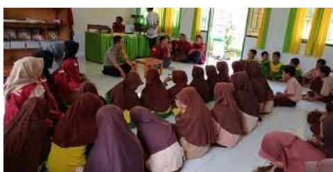
Gambar 1. Bhabinkamtibmas sedang melakukan edukasi cyberbullying

Hukum di Indonesia mengatur cyberbullying pada UU Nomor 11 Tahun 2008 terkait UU ITE dan perubahannya [11]. Konten dalam UU tersebut adalah terkait penghinaan melalui sarana komputer atau media elektronik melalui dunia maya. Adapun sanksi pidana maksimal 4 (empat) tahun dan/atau denda maksimal Rp750.000.000,00. Polresta Banyumas sesuai dengan tugasnya pada fungsi Binmas yakni melaksanakan pembinaan pada masyarakat meliputi pemberdayaan Polmas, ketertiban masyarakat dan kegiatan koordinasi melalui pengamanan swakarsa, kerjasama dalam pemeliharaan keamanan serta ketertiban masyarakat termasuk edukasi pencegahan tindakan pelanggaran UU ITE [12]. Polresta Banyumas melalui fungsi Binmas telah melakukan beberapa pencegahan tindak cyberbullying di lingkungan remaja melalui edukasi dengan sasaran usia remaja di Kab.Banyumas. Biasanya sasaran tujuan adalah sekolah tingkat SMP dan SMA. Kegiatan dilakukan melalui metode ceramah dan sambang yang dilakukan oleh Personel Bhabinkamtibmas Polresta Banyumas pada objek usia remaja. Gambar 1 berikut merupakan salah satu contoh kegiatan Binmas yang diadakan di salah satu sekolah di Kec.Kedungbanteng dalam upaya edukasi pencegahan tindak pelanggaran UU ITE Cyberbullying.