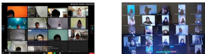
Gambar 3. Pelaksanaan webinar cyberbullying