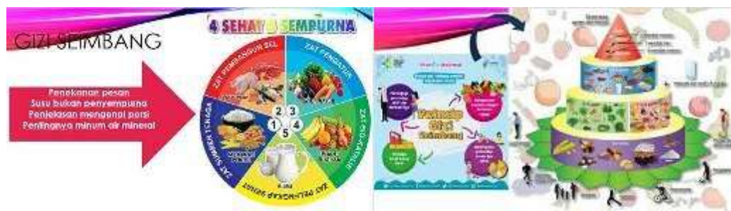
Gambar 1. Gizi seimbang

Materi yang disampaikan meliputi antropometri gizi :