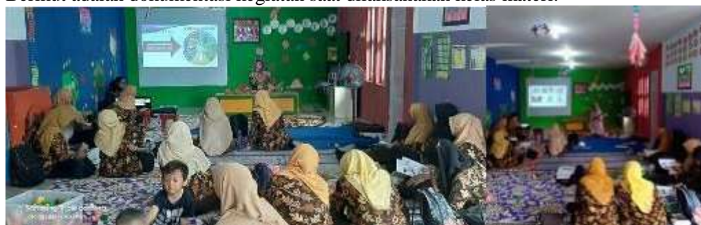
Gambar 5. Dokumentasi kegiatan pengabdian

Berikut adalah dokumentasi kegiatan saat dilaksanakan kelas materi.