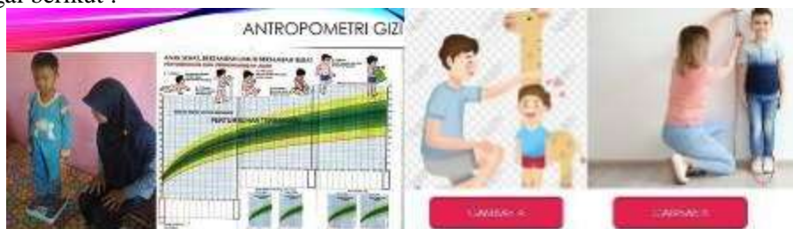
Gambar 2. Antropometri pada siswa KB dan TK

dan berbasis masyarakat. Pendidikan dan penyuluhan gizi dengan menggunakan slogan 4 Sehat 5 Sempurna yang dimulai 1952, telah berhasil menanamkan pengertian tentang pentingnya gizi dan kemudian merubah perilaku konsumsi masyarakat. Prinsip 4 Sehat 5 Sempurna yang diperkenalkan oleh Bapak Gizi Indonesia Prof. Poorwo Soedarmo yang terinspirasi dari Basic Four Amerika Serikat yang mulaidiperkenalkan pada era 1940an adalah menu makanan yang terdiri darimakanan pokok, lauk pauk, sayuran dan buah-buahan, serta minum susu untuk menyempurnakan menu tersebut. Namun slogan tersebut sudah tidak sesuai lagi dengan perkembangan ilmu dan permasalahan gizi dewasa ini sehingga perlu diperbarui dengan slogan dan visual yangsesuai dengan kondisi saat ini. Sehingga berdasarkan Peraturan Menteri Kesehatan RI No.41 tahun 2014, konsep gizi seimbang terdiri dari 4 pilar mencakup konsumsi makanan beragam, membiasakan perilaku hidup bersih, melakukan aktivitas fisik, mempertahankan dan memantau berat badan dalam kisaran normal. [1] Selain materi gizi seimbang, disampaikan juga materi antropometri gizi dan praktek sebagai berikut :