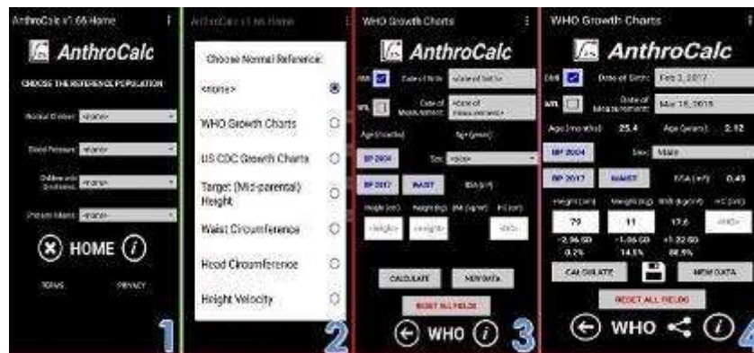
Gambar 3. Langkah-langkah menghitung status gizi dengan indeks BB/U dan TB/U

Praktek antropometri yang dilakukan adalah penimbangan dengan menggunakan digital scale dan pengukuran tinggi badan menggunakan microtoa. Penekanan pengukuran ini dilakukan untuk menekankan bahwa pemakaian baju yang seminimal mungkin dan sepatu dilepas agar hasil pengukuran tidak bias. Hasil pengukuran selama ini hanya dicatat berat badan dan tinggi badan saja tanpa dilakukan analisis status gizi anak berdasarkan antropometri. Pada kesempatan ini, tim memberikan materi cara menganalisis hasil pengukuran dengan software anthropometric calculator sebagai berikut :