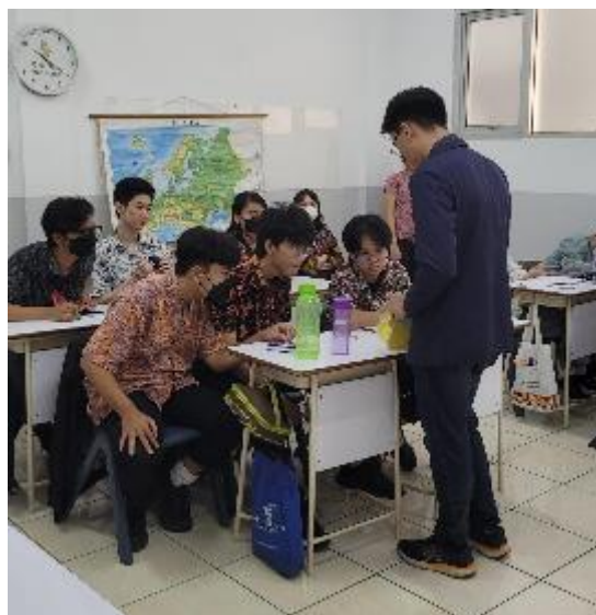
Gambar 6. Tim PKM Menjelaskan Alat Peraga