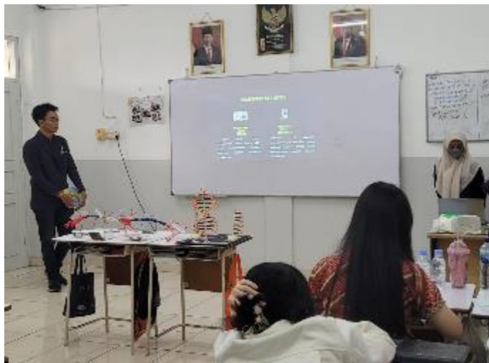
Gambar 5. Kegiatan Sosialisasi