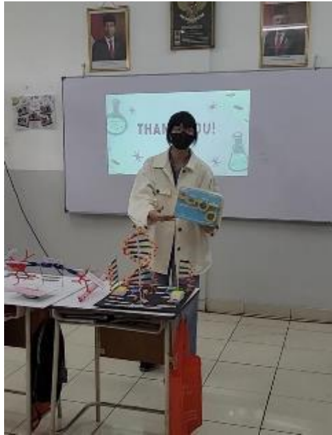
Gambar 7. Salah Satu Siswi Menjelaskan Ulang Materi Sosialisasi

Dari kegiatan sosialisasi ini, diperoleh nilai rata-rata post test sebesar 78.46, dimana menunjukkan kenaikan sebesar 9,23% dari nilai rata-rata pre test. Hal ini menunjukkan bahwa kegiatan sosialisasi ini bermanfaat bagi siswa-siswi kelas 12 SMA Kristen Menara Tirza.