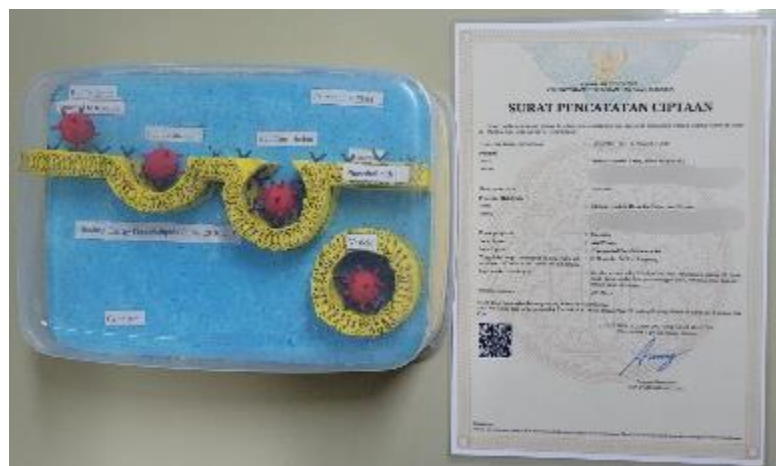
Gambar 3. Alat Peraga beserta HKI-nya

Kegiatan sosialisasi dilakukan dengan memberikan satu contoh dari transportasi pada membran sel yaitu proses masuknya virus corona ke dalam sel mamalia. Cara virus corona masuk ke dalam sel adalah dengan menggunakan reseptor protein yang terdapat pada sisi luar membran sel, duri protein yang terdapat pada virus corona akan berinteraksi dan berikatan dengan reseptor protein tersebut. Proses interaksi ini menandakan dimulainya infeksi. Setelah berikatan, virus akan mendorong membran sel ke bagian dalam dan masuk ke dalam sel. Saat masuk ke dalam sel, virus akan terbungkus vesikel yang merupakan fosfolipid dari membran sel. Ukuran vesikel akan menyesuaikan dengan virus tersebut. Penjelasan materi pada kegiatan sosialisasi dilakukan dengan cara mempresentasikan materi terdapat pada Gambar 4 dan dibantu oleh alat peraga Gambar 3.