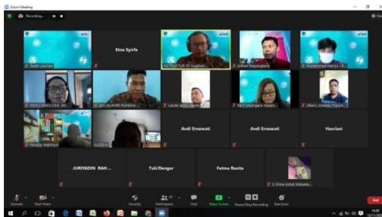
Gambar 2 Daftar Peserta Training of Trainer Pelatihan dan Kompetisi TIK Nasional Secara Daring Bagi Disabilitas