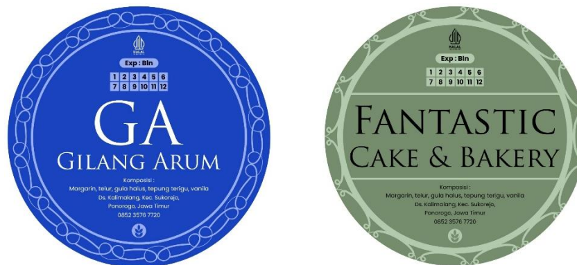
Gambar 2. Desain Logo 'Gilang Arum Cake' dan 'Fantastic Cake'

Selain itu, menurut Ni Komang Triana Dewi, dkk., dalam artikelnya bahwa setiap bentuk logo juga wajib mempunyai suatu ciri khas tertentu untuk membedakan logo yang satu dengan logo yang lainnya, baik itu dari segi bentuk maupun warnanya. Suatu logo yang digunakan akan menggambarkan kualitas seperti yang disimbolkan, seperti adanya pendekatan budaya perusahaan, penempatan posisi penting, atau aspirasi dari perusahaan itu sendiri [11]. Berikut ini adalah logo yang didesain oleh tim pengabdian masyarakat KKN-Tematik 35 sebagai identitas pada produk UMKM 'Roti Gilang Arum' dan 'Fantastic Cake'.