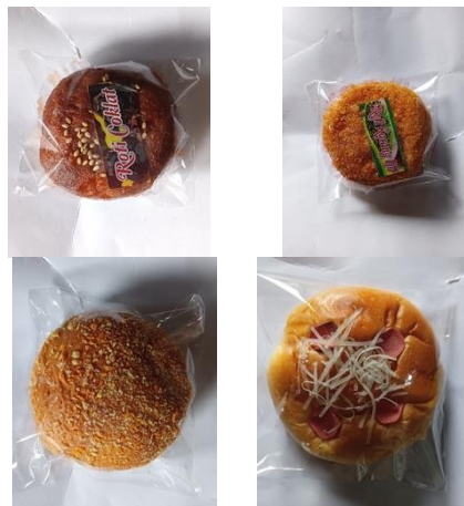
Gambar 4. Sampel Foto Produk 'Roti Gilang Arum'

Kegiatan selanjutnya yaitu proses pengambilan foto setiap jenis produk 'Roti Gilang Arum'. Visualisasi setiap foto mewakili produk yang telah diproduksi oleh mitra usaha, yang selanjutnya foto tersebut didokumentasikan. Kegiatan ini bertujuan untuk mendokumentasikan setiap produk 'Roti Gilang Arum' yang akan ditampilkan pada media katalog produk. Berikut ini beberapa sampel foto produk 'Roti Gilang Arum':