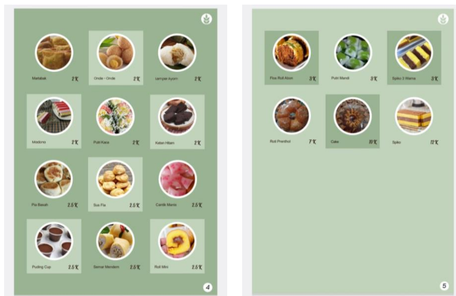
Gambar 5. Media Katalog Produk ‘Roti Gilang Arum’

Katalog sebagai media promosi dan strategi pemasaran produk belum pernah dilakukan oleh UMKM ‘Roti Gilang Arum’ sebelumnya. Sehingga berdampak dan berpengaruh terhadap penjualan produk yang kurang maksimal. Metode pemasaran yang masih manual, seperti penitipan produk ke toko atau pasar dan juga metode pemasaran dari mulut ke mulut menjadi kendala tersendiri. Sehingga dengan hadirnya media katalog produk tersebut menjadi peluang pelaku usaha untuk terus mengembangkan usahanya dan meningkatkan produktivitasnya, sehingga konsumen dapat dengan mudah dalam mencari, memilih, dan memesan produk yang diperlukan. Media katalog produk dapat digunakan secara berkala oleh mitra usaha, apabila terdapat perubahan varian, harga dan ketersediaan informasi produk dapat diperbaharui setiap waktu. Mitra usaha dapat memanfaatkan media katalog tersebut untuk pemasaran berbasis digital marketing dengan cara menampilkan katalog di Marketplace Facebook , WhatsApp bisnis, Instagram bisnis, dan media sosial lainnya.