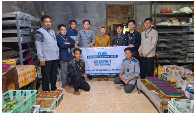
Gambar 3. Diskusi dan Interview bersama Mitra Usaha

Tahapan perancangan katalog produk diawali dengan kegiatan interview bersama mitra usaha yaitu pemilik 'Roti Gilang Arum'. Pada tahapan ini, tim pengabdian masyarakat mahasiswa KKN-Tematik 35 menyampaikan pentingnya konsep katalog produk yang akan dirancangnya untuk proses lebih lanjut. Dalam kegiatan interview tersebut pemilik 'Roti Gilang Arum' memberikan informasi terkait identitas usaha, profil pemilik mitra usaha, produk yang dihasilkan, sejarah berdiri dan perkembangannya serta kegiatan pemasaran produk. Kegiatan interview disajikan pada gambar di bawah ini: