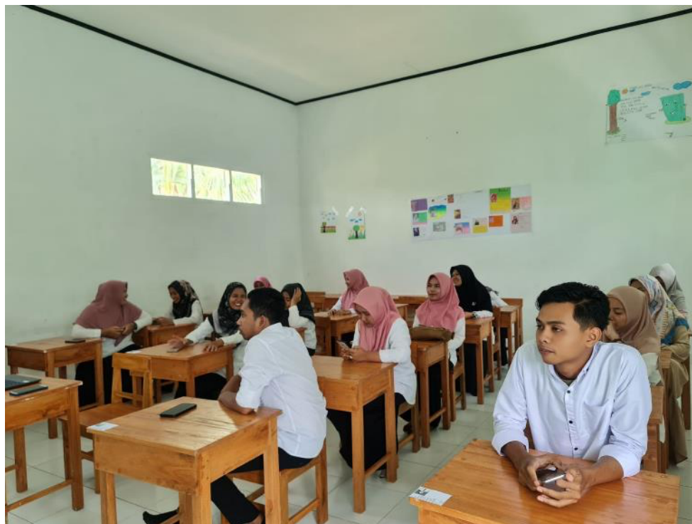
Gambar 2. Antusiasme Peserta dalam Kegiatan Pelatihan Penyusunan Modul Ajar b. Kegiatan 2

Kegiatan selanjutnya pada kegiatan pendampingan penyusunan modul ajar ini adalah merancang konsep modul ajar secara berkelompok. Pada kegiatan 1 peserta sudah memahami tentang konsep pembelajaran di kurikulum Merdeka, serta teknis dalam menyusun modul ajar, pemahaman tersebut menjadi bekal peserta untuk mampu menyusun modul ajar sesuai dengan kebutuhan kelas masing-masing. Pada kegiatan 2 ini pemateri membagi peserta menjadi beberapa kelompok. Pengelompokan didasarkan pada kelas yang diampu. Guru kelas 1 dan 2 menjadi satu kelompok untuk menyusun Modul ajar fase 1, guru kelas 3 dan 4 menjadi satu kelompok untuk menyusun modul ajar fase 2 dan guru kelas 5 dan 6 menjadi satu kelompok untuk menyusun modul ajar fase 3. Pembagian kelompok berdasarkan fase pembelajaran, bertujuan untuk mempermudah peserta dalam menentukan Capaian pembelajaran (CP), tujuan pembelajaran (TP) dan alur tujuan pembelajaran (ATP) yang akan disajikan dalam modul ajar.