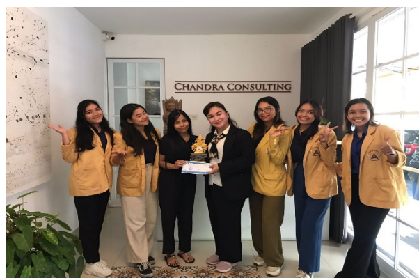
Gambar 5. Tim beserta peserta pelatihan penggunaan aplikasi KrisHand dan MYOB