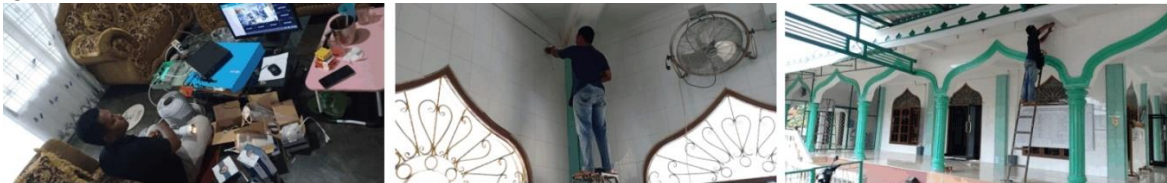
Gambar 2. Proses Pemasangan dan Pemantauan CCTV Masjid Al-Ihsan Pintu Air

Pemasangan CCTV dilakukan agar pengamanan masjid Al-Ihsan Pintu Air dapat dipantau oleh Pebgurus BKM Al-Ihsan Pintu Air.