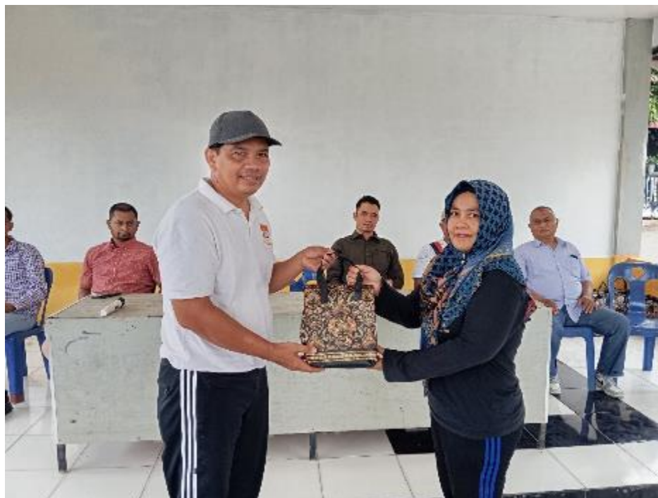
Gambar 8. Penyerahan sembako secara simbolis kepada warga