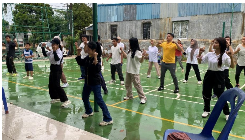
Gambar 1. Kegiatan Senam sehat

Kegiatan ini dimulai dari pagi jam 08.00 dengan kegiatan senam sehat bersama Dosen dan mahasiswa STIE Galileo bersama warga perumahan Puri Asri. Kegiatan senam sehat dapat dilihat sebagaimana gambar 1. Kegiatan senam sehat dilakukan sebelum kegiatan edukasi dengan tujuan supaya para peserta menjadi fit dan sehat sehingga dapat menyerap materi edukasi yang disampaikan pemateri dengan baik.