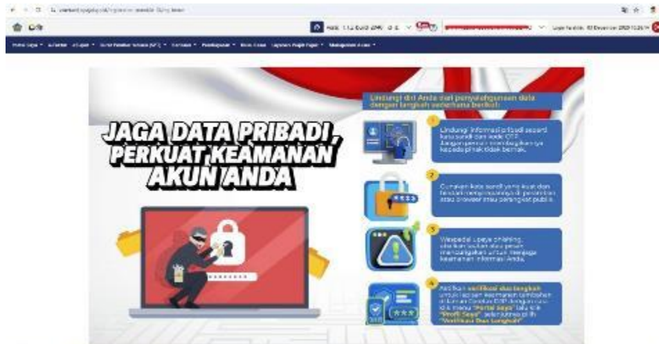
Gambar 6. Tampilan halaman utama CTAS

Diakhir kegiatan dilakukan diskusi tanya jawab sebagaimana gambar 7 dan juga dilakukan evaluasi dengan beberapa pertanyaan kepada peserta kegiatan pengabdian kepada Masyarakat. Hasil evaluasi lebih dari 95% peserta memahami materi yang disampaikan pemateri tentang penggunaan aplikasi Core Tax Administration System (CTAS) untuk pelaporan pajak.