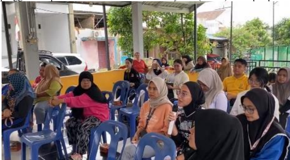
Gambar 7. Diskusi tanya jawab

Diakhir kegiatan dilakukan diskusi tanya jawab sebagaimana gambar 7 dan juga dilakukan evaluasi dengan beberapa pertanyaan kepada peserta kegiatan pengabdian kepada Masyarakat. Hasil evaluasi lebih dari 95% peserta memahami materi yang disampaikan pemateri tentang penggunaan aplikasi Core Tax Administration System (CTAS) untuk pelaporan pajak.