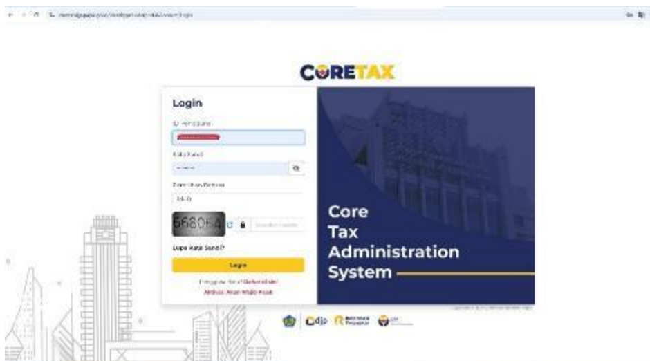
Gambar 5. Tampilan halaman login CTAS

Dalam sistem CTAS, para wajib pajak menggunakan Nomor Induk Kependudukan (NIK) sebagai identitas utama. CTAS mengintegrasikan berbagai proses perpajakan yang didalamnya mencakup pendaftaran (registrasi), pelaporan pajak, pembayaran, manajemen akun, penagihan, pemeriksaan dan layanan lain dalam satu portal berbasis web [6]. Sistem CTAS mulai diimplementasikan secara penuh pada tahun 2025. Pengguna dapat mengakses halaman web https://coretaxdj.pajak.go.id/identityproviderportal/Account/Login untuk melakukan login. Tampilan halaman login sistem CTAS dapat dilihat sebagaimana gambar 5.