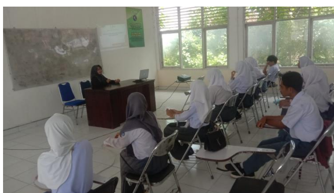
Gambar 3. Pelaksanaan Kegiatan

Persentase tingkat pemahaman mitra pada tahap pre-test menunjukkan bahwa sebagian besar peserta masih berada pada kategori Tidak Paham, yaitu sebesar 58,67%, diikuti oleh kategori Kurang Paham sebesar 29,33%, dan hanya 12,00% yang berada pada kategori Paham. Distribusi ini mengindikasikan bahwa mayoritas mitra belum memiliki pemahaman yang memadai terkait kearifan lokal Suku Buton sebelum pelaksanaan kegiatan edukasi. Rendahnya persentase pada kategori “Paham” menunjukkan bahwa pengetahuan awal peserta masih terbatas dan cenderung berada pada tahap pengenalan. Sementara itu, tingginya persentase pada kategori “Tidak Paham” dan “Kurang Paham” menegaskan adanya kebutuhan yang signifikan terhadap intervensi edukatif yang terstruktur dan kontekstual. Dengan demikian, hasil pre-test ini menjadi dasar yang kuat bagi pelaksanaan kegiatan pengabdian kepada masyarakat untuk meningkatkan literasi budaya dan pemahaman peserta terhadap nilai-nilai kearifan lokal secara lebih komprehensif. Berikut adalah dokumentasi pelaksanaan kegiatan.