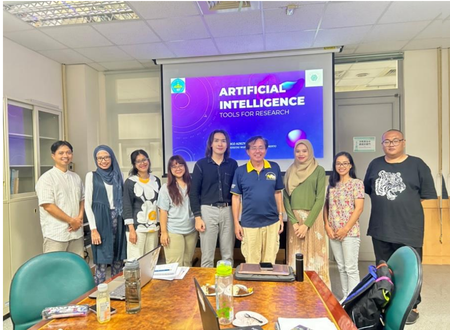
Gambar 3. Kegiatan Pengabdian di NYUST Taiwan