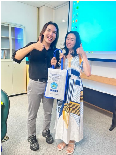
Gambar 4. Kegiatan Pengabdian di NYUST