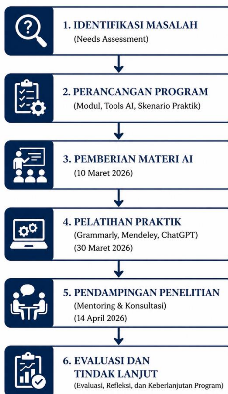
Gambar 1. Diagram Alur Kegiatan Pengabdian

Tindak lanjut kegiatan meliputi penyusunan modul pelatihan berkelanjutan, pembentukan komunitas pembelajaran berbasis AI, serta rencana integrasi teknologi AI dalam pembelajaran akademik, khususnya dalam mata kuliah metodologi penelitian.