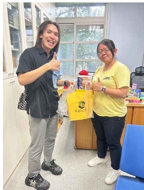
Gambar 5. Kegiatan Pengabdian di NYUST