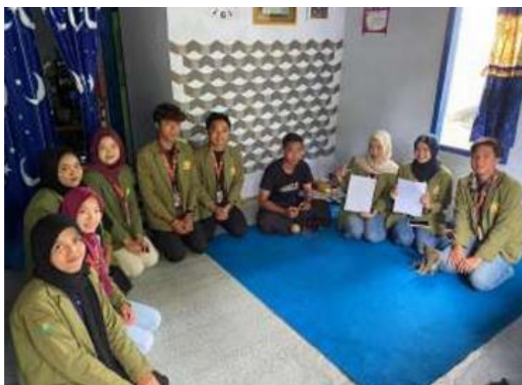
Gambar 4 penyerahan hardfile NIB Sepatu Rajut Naomi

Tahap terakhir yaitu mencetak Nomor Induk Berusaha (NIB) yang telah berhasil didaftarkan dan menyerahkannya kepada pelaku UMKM dalam bentuk softfile dan hardfile yang ditunjukkan pada gambar 4, serta memberikan penjelasan mengenai manfaat dokumen tersebut dalam pengembangan usaha. Kegiatan ini, kelompok pengabdian berhasil mendampingi beberapa pelaku usaha, salah satunya adalah UMKM Sepatu Rajut Naomi yang sebelumnya belum memiliki NIB. Adanya pendampingan langsung, pelaku UMKM tersebut berhasil memperoleh legalitas resmi. Selain itu, pendampingan juga dilakukan kepada BUMDesa Kemiri Lestari yang berhasil memperoleh tiga NIB untuk unit usaha HIPAM, unit susu, dan kelembagaan induk BUMDesa.