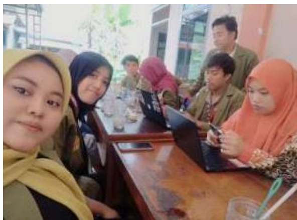
Gambar 2 pendampingan pembuatan NIB BUMDES Kemiri Lestari

Tahap selanjutnya adalah proses pembuatan NIB. Setelah seluruh data yang dibutuhkan terkumpul secara lengkap dan valid, kelompok pengabdian melanjutkan ke tahap registrasi melalui sistem OSS. Pembuatan NIB ini secara umum dapat diselesaikan dalam waktu sekitar dua hari kerja, tergantung pada kelengkapan dan keakuratan data yang telah dipersiapkan. Seluruh tahapan dilakukan melalui sistem daring OSS, dimulai dari pendaftaran akun baru hingga pengajuan hak akses sebagai pelaku usaha mikro dan kecil [16]. Proses ini menjadi langkah awal penting agar UMKM dapat memiliki identitas usaha resmi dan terdaftar secara legal dalam sistem perizinan nasional [11]. Legalitas ini nantinya akan memudahkan pelaku UMKM dalam mengakses berbagai program pembinaan, pendanaan, serta kemitraan usaha dari berbagai pihak, baik pemerintah maupun swasta [10].