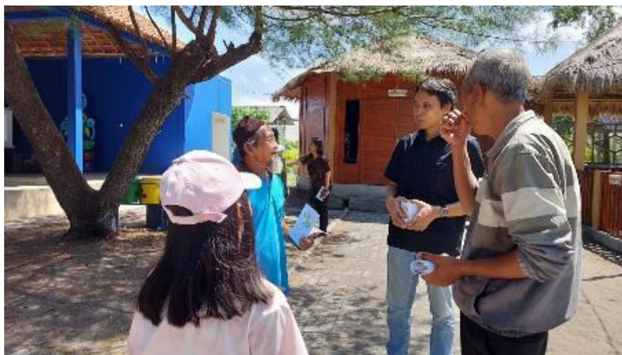
Gambar 4. Peserta senior menjelaskan proses penetasan penyu pada instruktur

tata bahasa dan lafal yang sempurna. Yang perlu mereka lakukan adalah mengucapkan kalimat agar pendengarnya memahami maksudnya.