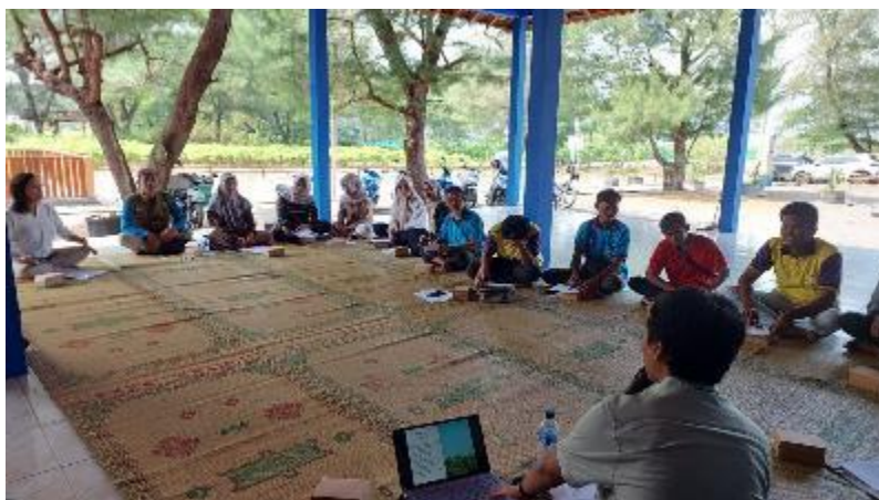
Gambar 3. Suasana Pelatihan di Desa Wisata Patihan, Pantai Goa Cemara, Bantul

Pelatihan Bahasa Inggris bagi para pelaku wisata di Desa Wisata Patihan dimulai sejak 30 Agustus 2025 dan berlangsung selama dua bulan dalam delapan sesi pertemuan. Tujuh [10] hingga delapan [11] pertemuan merupakan durasi yang efektif bagi pelatihan Bahasa Inggris untuk pemandu wisata. Pada awalnya peserta yang direkomendasikan oleh ketua Desa Wisata untuk ikut adalah delapan orang yang berpotensi untuk sering berinteraksi dengan wisatawan mancanegara. Namun, sejak hari pertama, berdasarkan inisiatif ketua desa wisata dan diskusi dengan tim pengabdian, peserta bertambah menjadi 17 orang. Tujuh belas peserta ini memiliki tugas dan tanggung jawab yang berbeda dalam kepengurusan desa wisata, di antaranya sebagai pendamping wisata, petugas parkir, petugas loket, staf administrasi desa wisata, hingga pedagang di kawasan desa wisata. Selama delapan sesi yang terlaksana, tingkat antusiasme para peserta sangat tinggi. Hal ini terlihat dari tingginya jumlah kehadiran di setiap pertemuan dan keaktifan para peserta dalam beraktivitas selama pelatihan berlangsung.