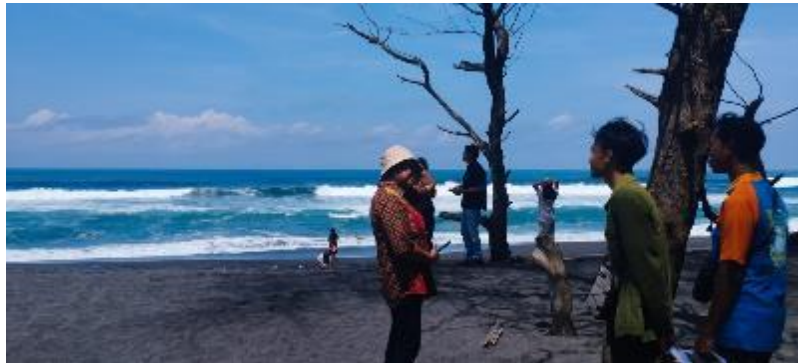
Gambar 6. Praktik wicara sambil menikmati suasana Pantai Goa Cemara, Bantul

Pengalaman terjun langsung dalam walking tour menyadarkan peserta mengenai pentingnya memahami lingkungan sekitar dan memperkaya kosa kata agar dapat menjawab keingintahuan pengunjung pada hal-hal yang menurut mereka tidak penting, misalnya bagaimana bertani di tepi pantai yang berpasir, bagaimana petani di tepi pantai mendapat air untuk menyiram tanaman, cara menemukan dan mengumpulkan telur penyu, proses penetasan telur penyu, pembuatan makanan lokal adrem yang memiliki bentuk khas, dan lain sebagainya. Saat menjelaskan inilah, peserta saling membantu untuk menemukan kata atau membuat kalimat dalam Bahasa Inggris. Di saat satu peserta merasa panik, peserta yang lain akan mengambil alih. Sebuah kerja sama yang muncul di saat mereka berada dalam situasi terjepit.