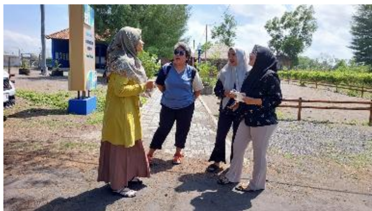
Gambar 5. Peserta menjelaskan konservasi penyu pada pengunjung asing

Pada pertemuan terakhir, Peserta diminta untuk menyelenggarakan walking tour bagi instruktur pelatihan dan pengunjung pantai. Peserta dibagi menjadi empat kelompok yang terdiri dari empat peserta dan dua pengunjung. Setiap kelompok ini diberi waktu satu jam untuk mendampingi pengunjung menikmati pantai. Mereka bergantian menjelaskan hal-hal yang ditemui di pantai dan sekitarnya serta menjawab pertanyaan yang diberikan oleh pengunjung. Dalam kegiatan ini buku saku menjadi pedoman untuk menjelaskan berbagai hal kepada pengunjung. Peserta terlihat antusias dan saat menghadapi masalah mereka saling membantu dengan cara menggantikan rekannya dalam menjelaskan. Pada saat kesulitan mencari kata, mereka terlihat menggunakan Bahasa Indonesia atau gerakan tubuh untuk menjelaskan apa yang ingin mereka sampaikan. Tim pengabdian juga mempersilakan para peserta untuk menggunakan teknologi seperti Google Translate jika mereka kesulitan untuk mencari kosa kata yang tepat. Ini membuat para peserta menjadi lebih tenang karena mereka tidak perlu panik dan khawatir jika terkendala dengan kosa kata [14].