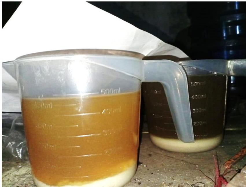
Gambar 6. Produk cair hasil pirolisis sampah plastik

Harapan kami alat ini bisa bermanfaat bagi warga desa Kedungringin terutama membantu warga dalam pengolahan sampah plastik di lingkungan sekitar mereka. Dengan berkurangnya sampah plastik, diharapkan tingkat pencemaran lingkungan berkurang dan kesehatan warga menjadi lebih baik. Semua produk hasil pengolahan sampah plastik ini bisa digunakan sebagai bahan bakar. Produk minyak bisa digunakan sebagai bahan bakar kendaraan bermotor, produk padat bisa digunakan sebagai bahan bakar briket untuk memasak rumah tangga. Tidak menutup kemungkinan dengan adanya alat ini bisa meningkatkan taraf perekonomian warga dengan cara menjual minyak hasil pirolisis plastik tadi dengan harga di bawah harga bahan bakar konvensional. Atau bisa juga dengan cara memberikan pelayanan pengolahan sampah plastik dari desa tetangga dengan dikenakan tarif yang tidak terlalu memberatkan masyarakat. Dengan cara ini diharapkan alat pengolah sampah plastik ini mampu untuk memperbaiki taraf perekonomian warga desa Kedungringin.