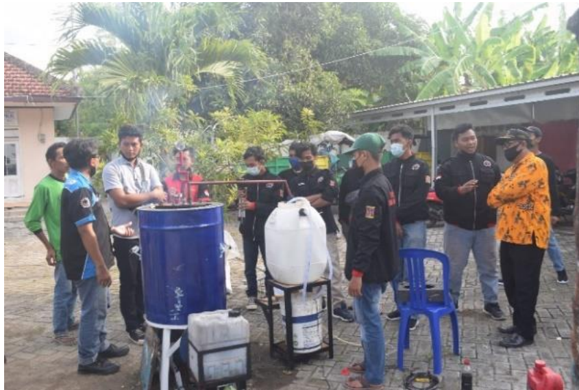
Gambar 5. Proses pengujian alat pirolisis