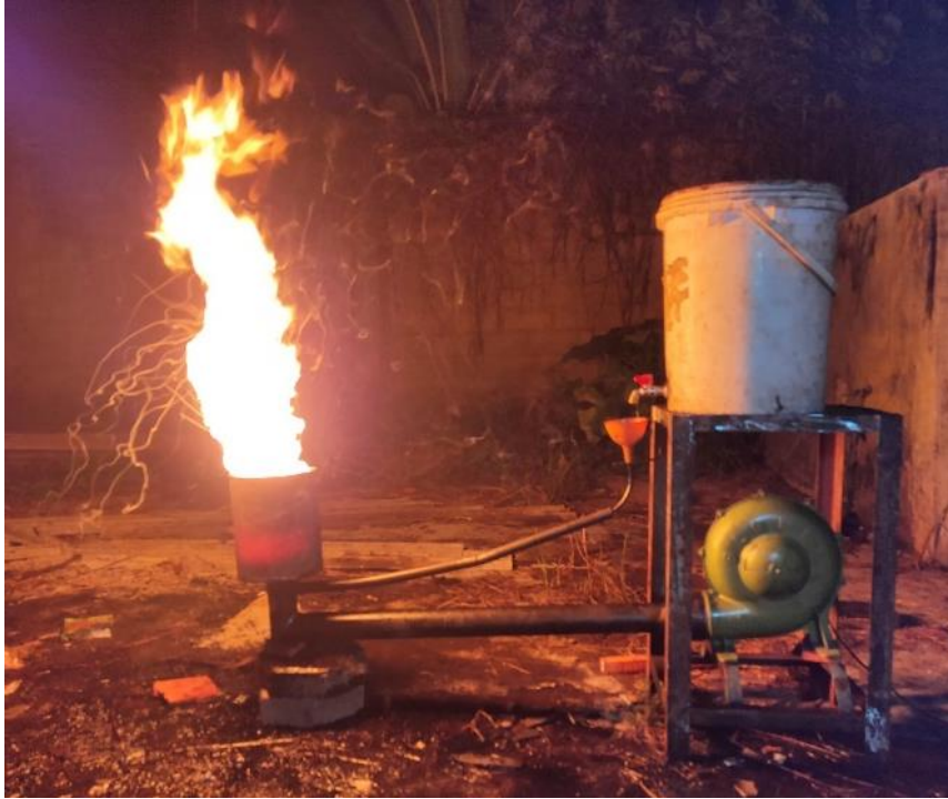
Gambar 4. Proses pengujian burner oli bekas

Setelah proses perencanaan, perancangan dan proses fabrikasi, maka langkah selanjutnya adalah proses pengujian awal alat pirolisis untuk memastikan alat dapat berfungsi dengan baik dan minim hambatan. Pengukuran panas pada alat ini menggunakan termometer. Massa sampah plastik yang digunakan diukur menggunakan timbangan digital untuk memastikan nilai pengukuran yang akurat, sedangkan waktu pengujian diukur menggunakan stopwatch.