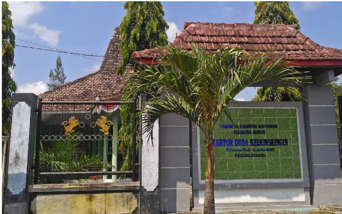
Gambar 1. Kantor Desa Kedungringin

permasalahan diantaranya adalah belum optimalnya pengelolaan sampah terutama sampah plastik.