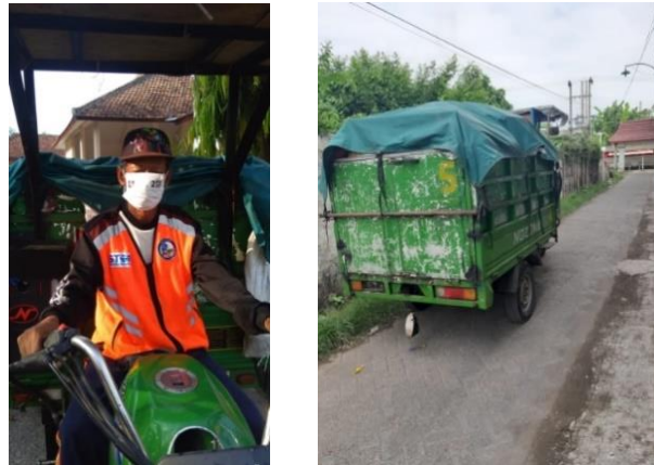
Gambar 2. Petugas pengangkut sampah dan kendaraan pengangkut sampah di program peduli sampah Desa Kedungringin.

Tujuan dari program pengabdian masyarakat ini antara lain adalah : 1). Mengurangi sampah plastik di lingkungan Desa Kedungringin yang mencemari lingkungan, 2). Mengolah sampah plastik menjadi sesuatu yang bermanfaat, bernilai ekonomi tinggi dan mencukupi kebutuhan energi di masyarakat berupa bahan bakar alternatif, 3). Memberdayakan masyarakat Desa Kedungringin untuk meningkatkan keterampilan dan penghasilan tambahan dengan memanfaatkan sampah plastik menjadi produk yang lebih berguna, 4). Mempromosikan kepada masyarakat umum bahwa warga Desa Kedungringin mampu memanfaatkan sampah plastik menjadi sumber energi terbarukan yang dapat membantu bahkan mencukupi kebutuhan energi Indonesia, 5). Mengembangkan Desa Binaan berbasis ekonomi kreatif sebagai contoh Desa yang mempunyai industri energi terbarukan yang dapat membangun dan meningkatkan perekonomian masyarakat menjadi lebih baik. Mengolah sampah plastik menjadi bahan bakar alternatif dengan memanfaatkan teknologi pirolisis adalah pilihan yang bijak dan prospektif. Hal ini dikarenakan selain mengurangi timbunan sampah plastik, mengurangi pencemaran lingkungan, namun juga bisa mendatangkan keuntungan secara ekonomi kepada masyarakat sekitar.