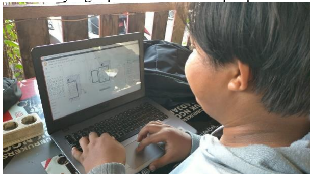
Gambar 2. Gambar Perancangan Alat Pengering otomatis

Pembuatan rancangan alat pengering otomatis dilakukan menggunakan 2 aplikasi yaitu sketchup dan draw.io. Rancangan alat pengering yang dihasilkan berupa oven yang memiliki sumber panas dari udara blower yang dipanaskan oleh kompor pemanas otomatis.