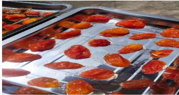
Gambar 1. Pembuatan tomat kurma dengan metode konvensional

Untuk mengatasi permasalahan tersebut masyarakat di desa Giripurno memanfaatkan oven yang sumber panasnya berasal dari kompor lpg karena tidak bergantung pada cuaca dan lebih higienis karena tempatnya tertutup. Namun penggunaan oven pemanas kompor ini juga dirasa kurang efektif, hal dikarenakan pada saat pemanasan oven ini tidak bisa diatur suhu/temperaturnya. Sehingga pada saat produksi tomat kurma suhu yang digunakan berubah-ubah atau tidak konsisten, hal ini menyebabkan hasil produksi tomat kurma yang sebagian cenderung kurang matang dan ada juga yang gosong atau lewat matang. Berdasarkan permasalahan ini tim bina desa skema pengolahan buah dan sayur memiliki inovasi pembuatan rancangan alat pengering otomatis yang dapat diatur temperatur dan waktunya agar lebih mengefisiensikan waktu dan jumlah bahan produksi yang terbuang sia-sia selama proses produksi.