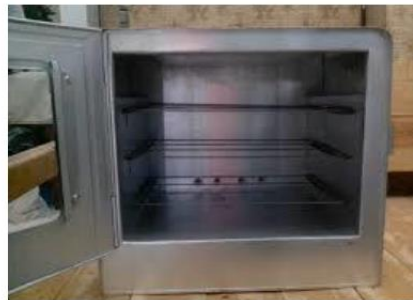
Gambar 3. Oven kompor

produsen sangat rugi karena hal ini. Untuk mengatasi permasalahan ini warga mulai menggunakan oven kompor/tungku. Oven ini memiliki sumber panas yang berasal dari api kompor gas lpg.