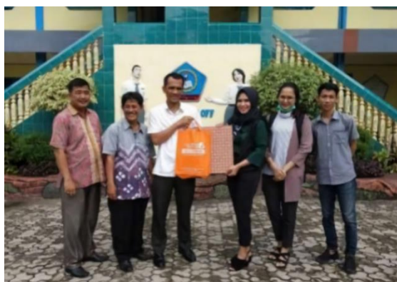
Gambar 2. Foto bersama dengan Kepala Sekola, Staff dan Guru

Hasil yang didapat dari pelatihan pengembangan dan penggunaan website SMA Fitra Abdi Palembang, pertama dilihat dari sisi kemampuan peserta dalam memahami materi dan yang kedua dilihat dari hasil kerja yang dihasilkan. Pada hasil capaian yang pertama kemampuan yang didapat peserta berupa : (1) Peserta mampu mengelola dan menggunakan website SMA Fitra Abdi Palembang dengan baik dan benar. (2) Guru, staff dan siswa dapat memanfaatkan website sekolah sebagai media dalam menyalurkan kreatifitas dengan mudah dan cepat.