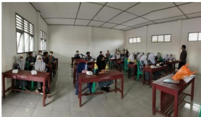
Gambar 3. Kegiatan Pengabdian Masyarakat Di SMA Fitra Abdi Palembang

Kegiatan Pengabdian ini sebagai tolak ukur untuk pengetahuan dan pemahaman seorang Siswa dan guru dalam lebih baik lagi atau dapat memanfaatkan dalam menggunakan teknologi informasi yang saat ini berkembang dengan sangat pesat. Dapat dilihat pada Gambar 3 Siswa sangat tertarik dalam pelatihan dan pengembangan website sekolah di SMA Fitra Abdi Palembang untuk Mengimplementasikan School Go-Digital[10].